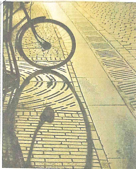
The photograph which helped Dr Akhter bag the International Photography Award's (IPA) in One-shot/Street Photo contest at Los Angeles, USA.